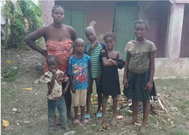
Smith met zijn moeder, twee broertjes en twee van zijn zussen.

Smith zijn moeder vertelt dat ze heel blij en opgelucht zal zijn als iemand haar zoontje wil sponsoren zodat hij naar school kan gaan.